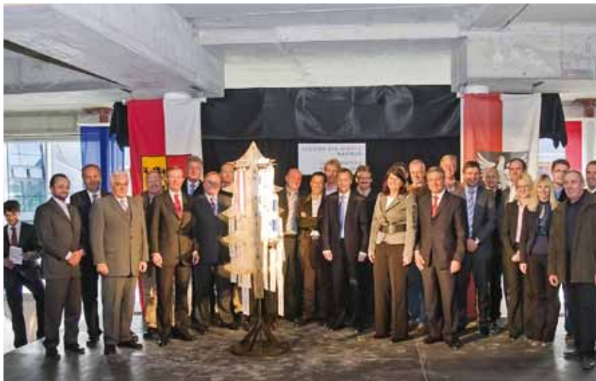
Gleichenfeier: Zur Demonstration der erfolgreichen Partnerschaft schmückten alle 33 Partner mit Fähnchen ihrer Logos den Firstbaum

Über 250 Festgäste und Arbeiter, an der Spitze LHF Burgstaller, kamen am 29.10. zur Gleichenfeier. Die Festredner LHF Burgstaller, LHStv. Haslauer, Dir. Troger und Bürgermeister Karlsböck bedankten sich bei den Verantwortlichen und den Arbeitern für die erfolgreiche und termingerechte Fertigstellung des Rohbaus. Die Festredner hoben besonders hervor, dass das Projekt Tauern SPA World nur durch den regionalen Zusammenschluss der 11 Gemeinden und die gemeinsame Kraft aller Partner möglich war. Zur Demonstration der erfolgreichen Partnerschaft schmückten alle 33 Partner mit ihren Logos den Firstbaum.