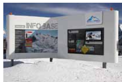
Die neue Freeride Info Base beim Alpincenter mit Infos über die Routen, Lawinenlage, LVS-Geräte-Check-Point u.vm.

stufe angepasst. Im Bereich Sonnenkar wurden neue Leitungen verlegt und Zapfstellen installiert. Ab dieser Saison können somit auch der Bereich Schmidinglerlifte, Gratbahn und der Central Park beschneit werden. Als Verbindung zum Speicherteich Langwiedboden wurde eine weitere Transportleitung verlegt, wodurch eine Wassernachspeisung für den Gletschersee möglich ist. Der Ausbau der Beschneigung stellt sowohl baulich als auch technisch eine große Herausforderung für das Unternehmen dar, da die hochalpine Lage enge Zeitlimits vorgibt und nahezu alle Leitungen aufwändig im Fels zu verlegen sind. Faktoren, die sich auch finanziell niederschlagen. Der Bau der Beschneigungsleitungen in diesem hochalpinen Umfeld kostet bis zum Sechsfachen, wie in talnäheren Skigebieten.