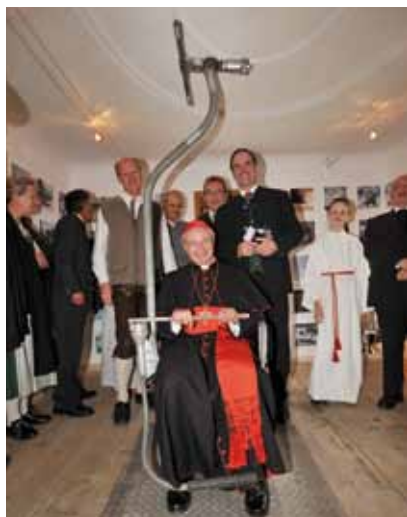
Erzbischof Dr. Kothgasser bei der Führung durch das Kaprun Museum.