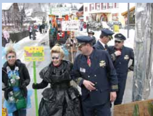
Beste Stimmung beim Faschingsumzug