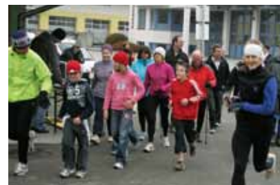
Nach über einem Jahrzehnt fand in Kaprun wieder der Fit Marsch - Fit Lauf statt.

Das spannende Finale zwischen dem FC Marley Kaprun und dem HFC St.Jakob/Thurn, entschieden die Kapruner eindrucksvoll mit 3:0.