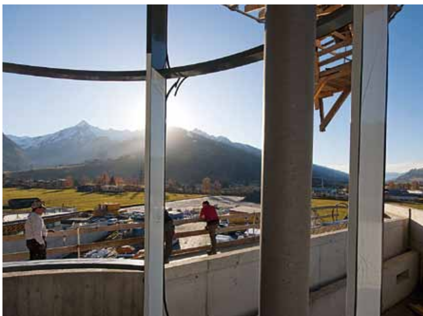
Ein atemberaubender Blick auf das Kitzsteinhorn, im Einklang mit der Natur

Baubeginn September 2008 Gleichenfeier Oktober 2009 Fertigstellung November 2010 Inbetriebnahme Dezember 2010