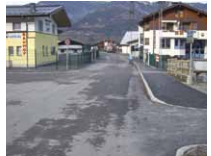
Die verbreiterte, neu gestaltete Augasse

Für die Erschließung der Tauern-Spa-World wurde in diesem Jahr die Augasse von der Kreuzung Altstraße bis zur Fa. Lachmayr verbreitert und ein Gehsteig errichtet. In diesem Zuge wurden die bestehenden Abwasser- und die Trinkwasseranlagen adaptiert. Weiters wurde die Tauerntiefengrundwasserleitung vom Auhof bis zur Fa. Lachmayr und die Heilwasserleitung die vom Bohrloch bei der Burg Kaprun entlang des Radweges bis zur Kreuzung Feldstraße/Augasse verläuft ebenfalls bis zur Fa. Lachmayr mitverlegt. 2010 wird die Augasse ab der Fa. Lachmayr bis zur Tauern-Spa-World verbreitert mit einem Geh- und Radweg und die erforderlichen Versorgungsleitungen werden mitverlegt. Für die weitere Erschließung der Tauern-Spa-World wird die Tauern-Spa-Straße ausgebaut, und ein Kreisverkehr im Bereich Blumenland errichtet.