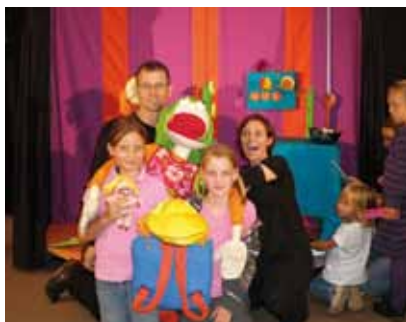
Auch heuer bot KUKI für junge Kulturfans ein abwechslungsreiches Programm