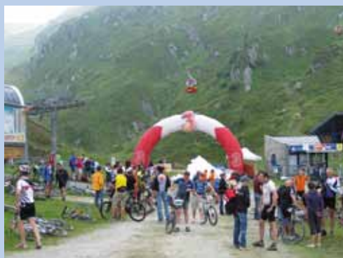
Bike Infection - Kitzsteinhorn Snow Climb 2009