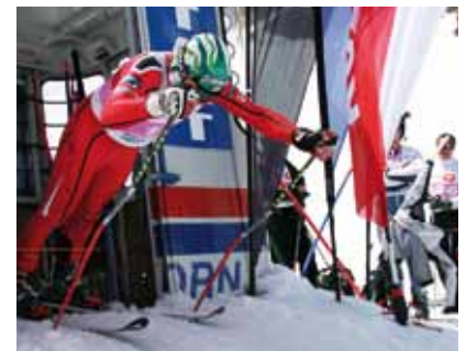
Ski Alpin Superstar Bode Miller bei der Ski & Golf WM 2009