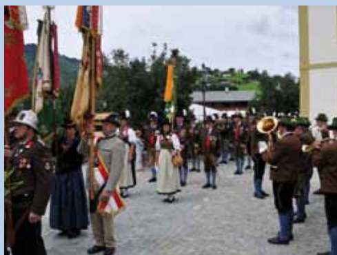
Aufmarsch der Kapruner Traditionsvereine