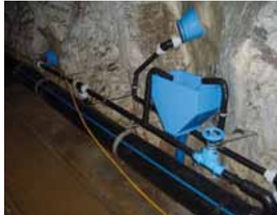
Quellfassung im Limbergstollen

Die Gemeinde Kaprun ist mit der bisherigen Trinkwasserversorgung bei Bedarfsspitzen an der möglichen Versorgungsgrenze angekommen. Mit der Errichtung der Tauern SPA World und unter Berücksichtigung der zukünftigen Bedarfssteigerung, kann nur durch Erschließung neuer Trinkwasservorkommen und Erhöhung des bisherigen Konsensmaßes die ausreichende Versorgung gesichert werden.