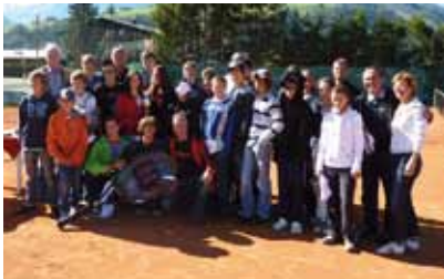
Die Teilnehmer des internationalen ALPENCUPS in Kaprun bei der Siegerehrung!

Der Trend, dass das Angebot der SHS Kaprun verstärkt nachgefragt wird, hält weiter an. Mit Stichtag 01. Oktober besuchen 272 Schüler die SHS. Im laufenden Jahr wurden folgende pädagogische Schwerpunkte gesetzt: - Schuldemokratie leben - Eigenverantwortliches Arbeiten - Peer Mediation seit 2007