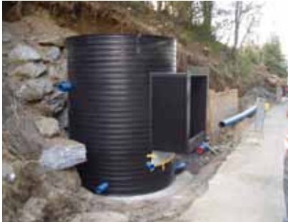
Einbau Unterbrecherschacht Bürgkogel