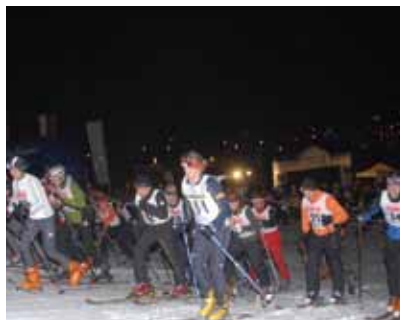
Massenstart beim Aufi Owi Skitouren-Rennen in Kaprun