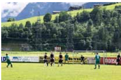
In einem spannenden Finale setzte sich der FC Marley Kaprun gegen den HFC St. Jakob/Thurn mit 3:0 durch.