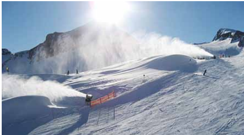
Das neue Pumpwerk Gletschersee II

Schon im frühen Herbst ein perfekt weißes und umfangreiches Pistenangebot, das auch über den Gletscher hinausreicht, ist die Basis für einen frühen Saisonstart und einen wirtschaftlich erfolgreichen Saisonverlauf in unserer gesamten Region. In den wichtigen Bereich der Schneesicherheit und Pistenqualität investieren die Kapruner Gletscherbahnen in den nächsten Jahren rund 20 Millionen Euro. Priorität in dem kurz- und mittelfristig angelegten Kitzsteinhorn-Schneekompetenz-Projekt hat die zukünftige Sicherung