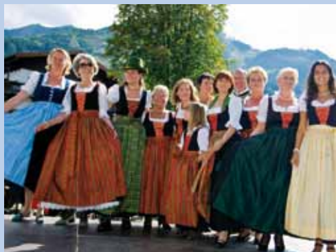
Anlässlich des diesjährigen Käsefestivals wurde als eines der Highlights das von Kapruner Frauen entworfene und selbst geschneiderte „Kapruner Dirndl“ präsentiert.