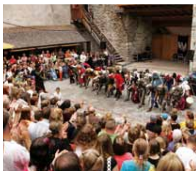
Auch 2009 begeisterte das Burgfest wieder viele Mittelalter-Freunde