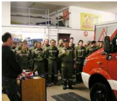
Feierliche Übergabe des neuen Löschfahrzeuges an die Freiwillige Feuerwehr Kaprun.