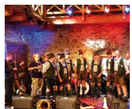
Ausgelassene Stimmung beim Musikevent „Mit'n Kopf zom, mit'n Oasch zom“