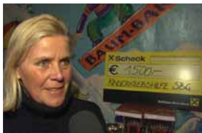
Rekordbeteiligung beim 3. Int. Maiskogelfanlauf am 07.03.09 zu Gunsten der Kinderkrebshilfe Salzburg.